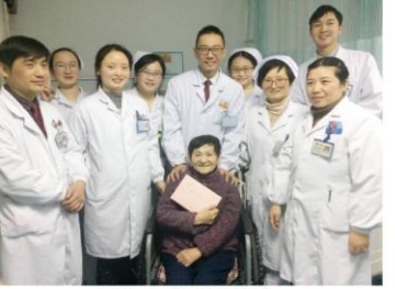
医护人员与“80 后”婆婆合影

“我是 80 后!”这是鲍婆婆自己打趣时笑着说的。84 岁高龄的她因脑出血后左侧肢体偏瘫,于 2016 年 8 月 19 日来到我院康复医