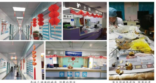
护士站 卒中单元 年味儿满满的病房,温馨而整洁