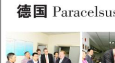
“湖北省水上紧急医学救援医院”授牌

我在康复科等你 你带着时光的馈赠与我相逢在康复科的病房 你在病房的那边 我在病房这边 我们隔着遥远的距离