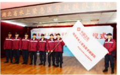
“湖北省水上紧急医学救援医院”授牌