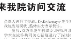
湖北省水上紧急医学救援人员合影

我在康复科等你 你带着时光的馈赠与我相逢在康复科的病房 你在病房的那边 我在病房这边 我们隔着遥远的距离