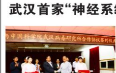
“湖北省水上紧急医学救援医院”授牌