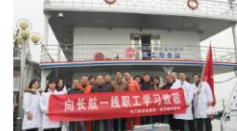
湖北省水上紧急医学救援人员合影

我在康复科等你 你带着时光的馈赠与我相逢在康复科的病房 你在病房的那边 我在病房这边 我们隔着遥远的距离