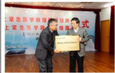
“湖北省水上紧急医学救援医院”授牌