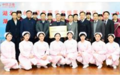
湖北省水上紧急医学救援人员合影

本报讯 为应对水上突发事件的应急救援,促进内河水上运输和旅游健康发展,12月23日,在湖北省卫计委、长江航运管理局支持下,湖北省首个“水上紧急医学救援医院”在我院授牌成立,以此为基础,将建立覆盖湖北省内1000多公里的长江干支流“水上紧急医学救援基地”及“水上紧急医学救援基地”,把优质服务带给群众。