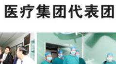
“湖北省水上紧急医学救援医院”授牌